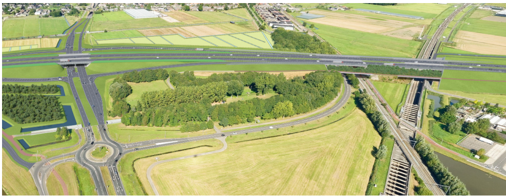
Toekomstige situatie omgeving N209 met de nieuwe A16 Rotterdam over het vervallen Doenkadeplein en de nieuw te bouwen viaducten