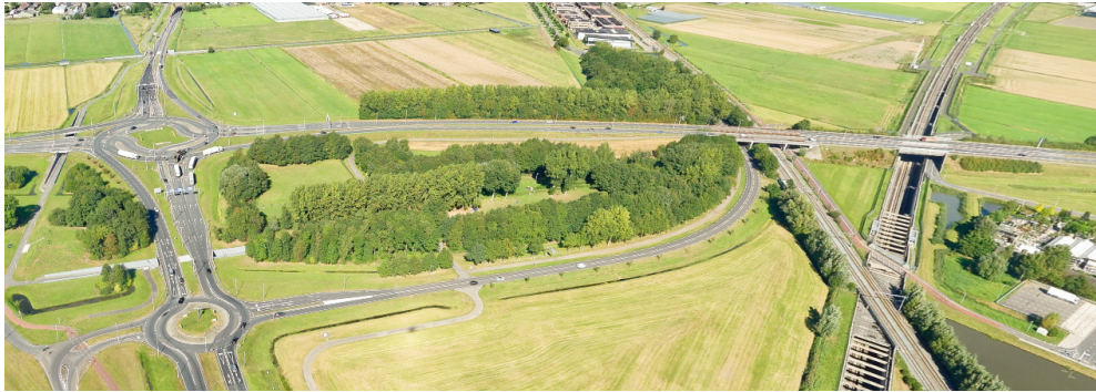
Huidige situatie omgeving N209

Rotterdam en Lansingerland beter bereikbaar en leefbaar